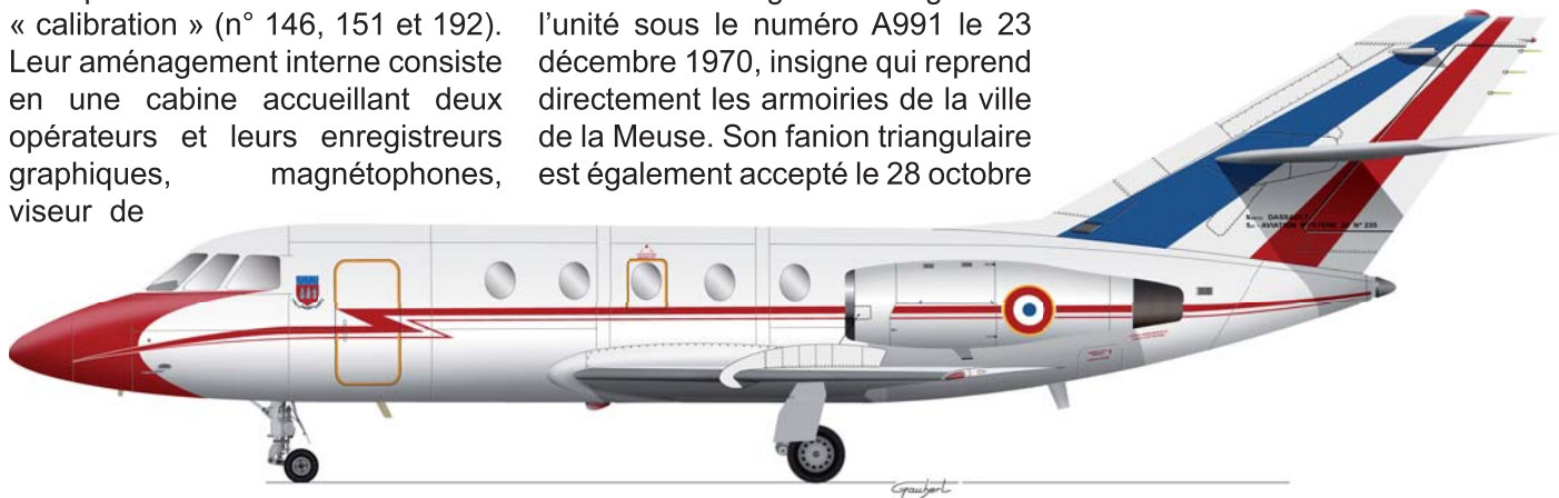
Un MYSTERE 20 au « nez rouge », signe distinctif des appareils de l'EC 57. Les avions du Commercy portaient l'insigne d'unité sur le fuselage, derrière les vitres du cockpit.

1970. Avril 1976 voit l'arrivée du premier Mystère 20 (n°291 / F-RAEC/65-EC) et mai 1981, celle du second (n°422 / F-RCAL puis F-RAEH / 65-EH), entamant le retrait définitif des Nord. Le 1 er septembre 1984, l'EC 57 « Commercy » est intégré au GAEL pour y devenir l'Escadron de calibration 3/65 «Commercy», mais ce n'est pas son dernier changement d'identité : juillet 1987, l'EC 3/65 devient «ECT 3/65», « T » pour transport car l'unité reçoit les autres Mystère 20 VIP de la 65e ET. Finalement, le 1 er mai 1991, avec la déflation de la flotte de Mystère 20, l'ECT 3/65 « Commercy » est dissous et la mission de calibration est reprise par l'ET 2/65 « Rambouillet ». Pour autant, c'est à l'équipage du Mystère 20 n°291 que revient l'honneur de clôturer les vols sur cet avion dans l'Armée de l'air. Le 27 mars 2007, revenant d'une ultime vérification des équipements de la BA 188 de Djibouti, le dernier biréacteur de « la Cal » met un terme à la mission de calibration militaire, débutée 42 ans auparavant, mais aussi à la carrière du biréacteur de Dassault dans l'armée de l'air, 41 ans après son entrée en service au GLAM.